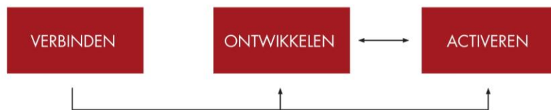
Afbeelding 1 – Structuur Pijlers Visie Bestuur 126: Verbinden, Ontwikkelen, Activeren

In de basis is ons beleid gestoeld op drie doelen: verbinden, ontwikkelen, activeren. Deze doelen zijn voortgekomen uit analyses over wat de vereniging de laatste jaren is geweest, en wat wij willen dat de vereniging het komende jaar gaat zijn. Het jaar na het lustrum, en een start met het schrijven van het tweede meerjarenplan, betekent voor ons een kans om de vereniging kritisch te bekijken en in de basis nieuwe en ambitieuze doelen te stellen.